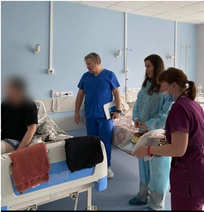
Регулярно відвідуємо поранених

Останні вже майже 10 років все, що ми робимо в тилу не було б можливим без героїчного внеску наших військовослужбовців. Саме вони тримають єдиний фронт і дають нам можливість розвивати інші сфери держави.