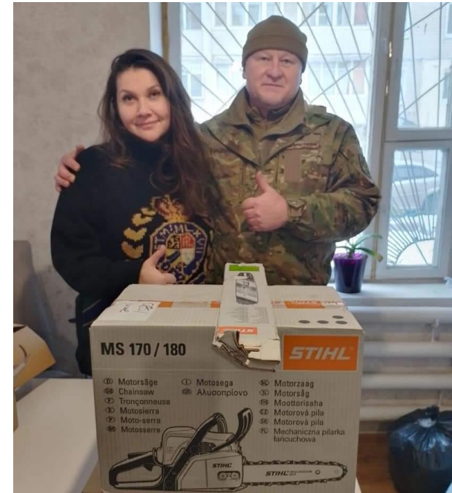
Передаємо допомогу у вигляді інструментів для фортифікаційних споруд та грілки