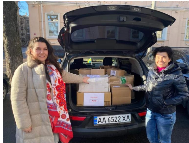
Аптечки, турнікети та засоби особистої гігієни на фронт