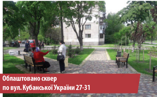
Облаштовано сквер по вул. Кубанської України 27-31