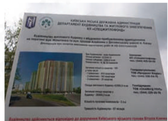
Паспорт об'єкту для переселення мешканців