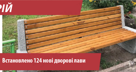
Встановлено 124 нові дворові лави