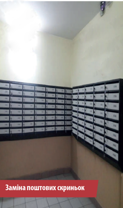
Заміна поштових скриньок