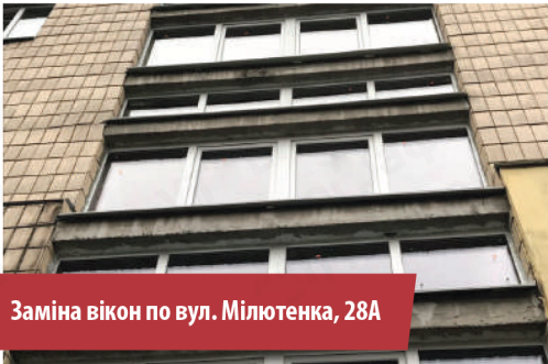
Заміна вікон по вул. Мілютенка, 28А