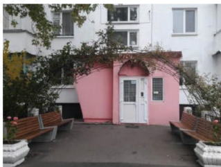
Будинок по вул. Шолом-Алейхема, 20