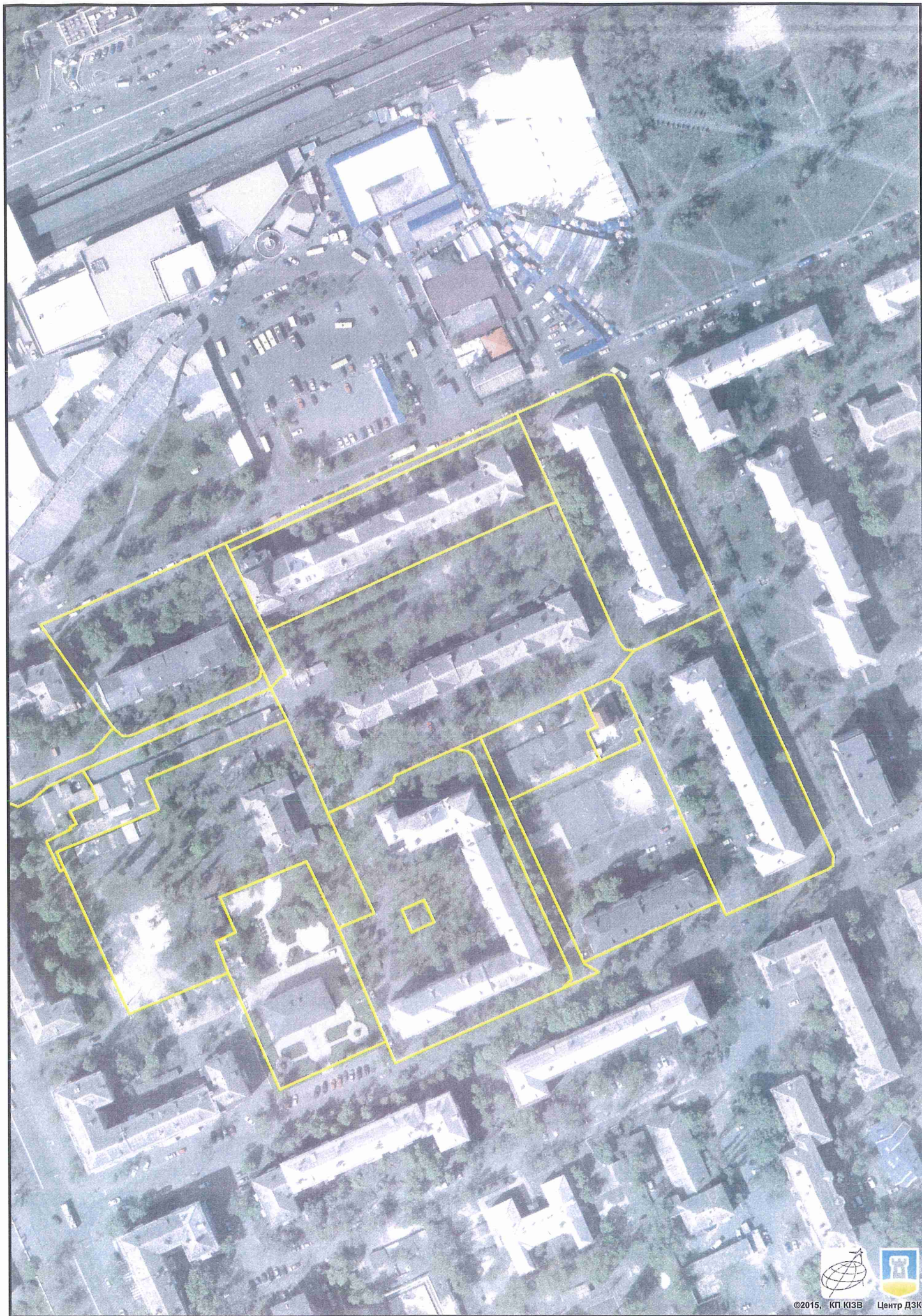
Растри аерофотозйомки 2014р.