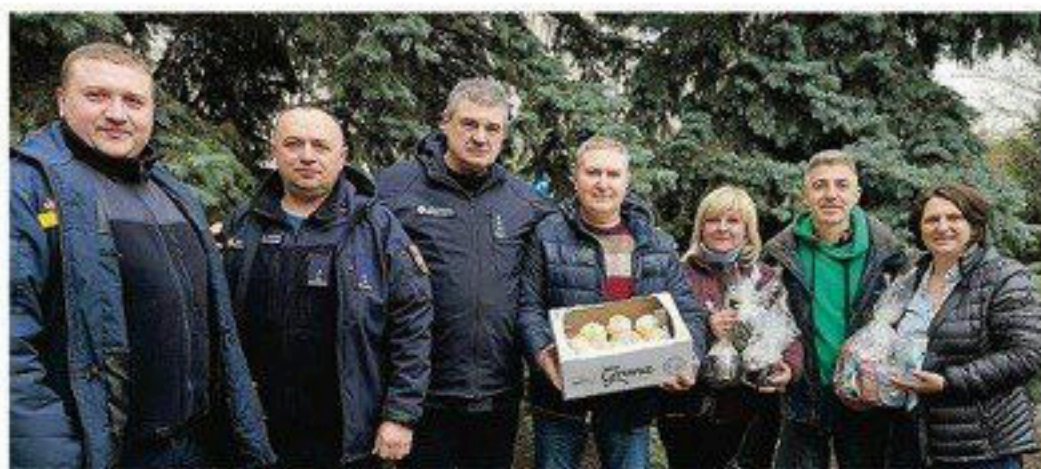
Постійна підтримка ДСНС та підрозділів ЗСУ впродовж року