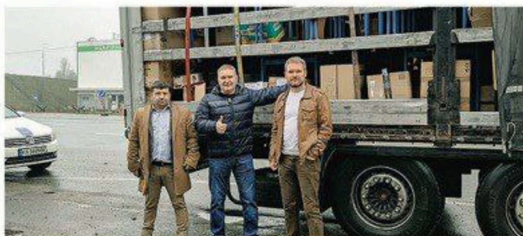
Протягом року доставляємо одяг, продукти та іншу допомогу мешканцям деокупованих територій