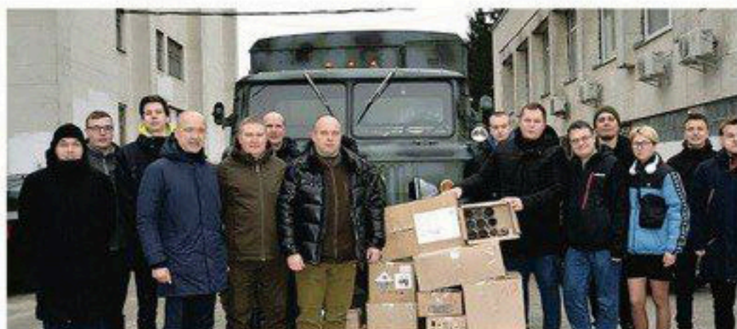
Передали командуванню Сил територіальної оборони ЗСУ вантажний автомобіль ГАЗ-66 підвищеної прохідності 4x4 та більше тисячі окопних свічок