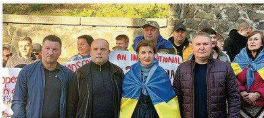
Ми рішуче виступаємо проти будь-якої співпраці з росією та проводимо акції в підтримку України