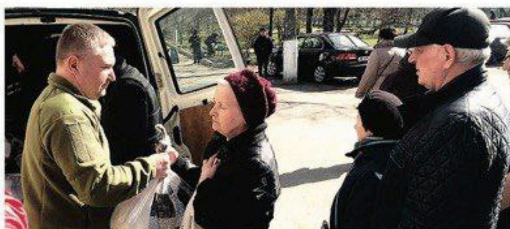
З перших днів війни робимо все можливе заради допомоги мешканцям Києва та внутрішньо переміщеним особам