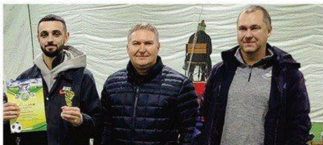
Проводимо культурні та спортивні заходи, зокрема чемпіонат і турніри Дніпровської аматорської футбольної ліги