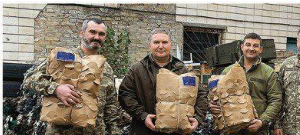
Допомагаємо 128-у батальйону територіальної оборони Дніпровського району