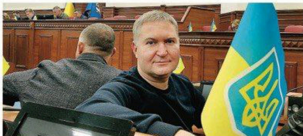
Брав участь в усіх пленарних засіданнях, а також став суб'єктом подання 22 проектів рішень, з яких 17 ухвалені Київською міською радою