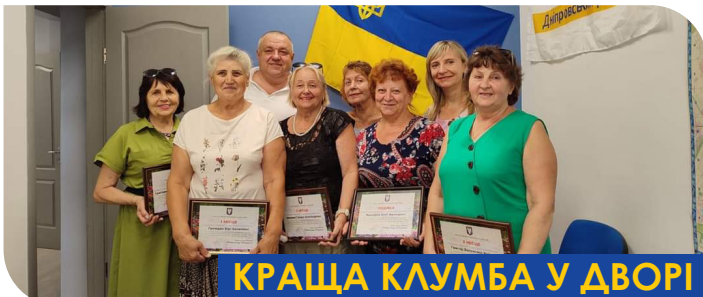
КРАЩА КЛУМБА У ДВОРІ

Щорічно до дня Незалежності України було проведено конкурс «Найкращий квітник у дворі». Краса доквітля робить людину добрішою і сильнішою. Добро є силою та потужним стержнем тилу, що наближає Перемогу! Призи і заохочувальні подарунки були вручено всім учасникам конкурсу.