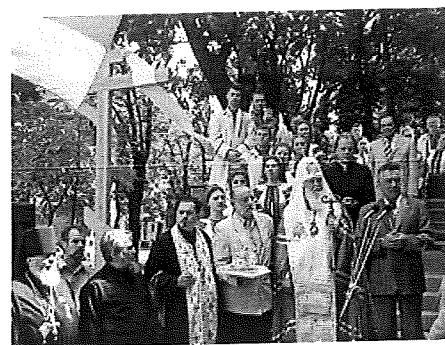
Церемонія закладення наріжного камню на місці відбудови Стрітенської церкви. У центрі (справа наліво): Київський міський голова Олександр Омельченко, Патріарх Філарет, архітектор Янош Віг, о. Сергій Ткачук

Фракція Блоку 23 — 12 «Наша Україна — Народна самооборона» листопада 2007 грудня 2012 (до 04.10.2011)