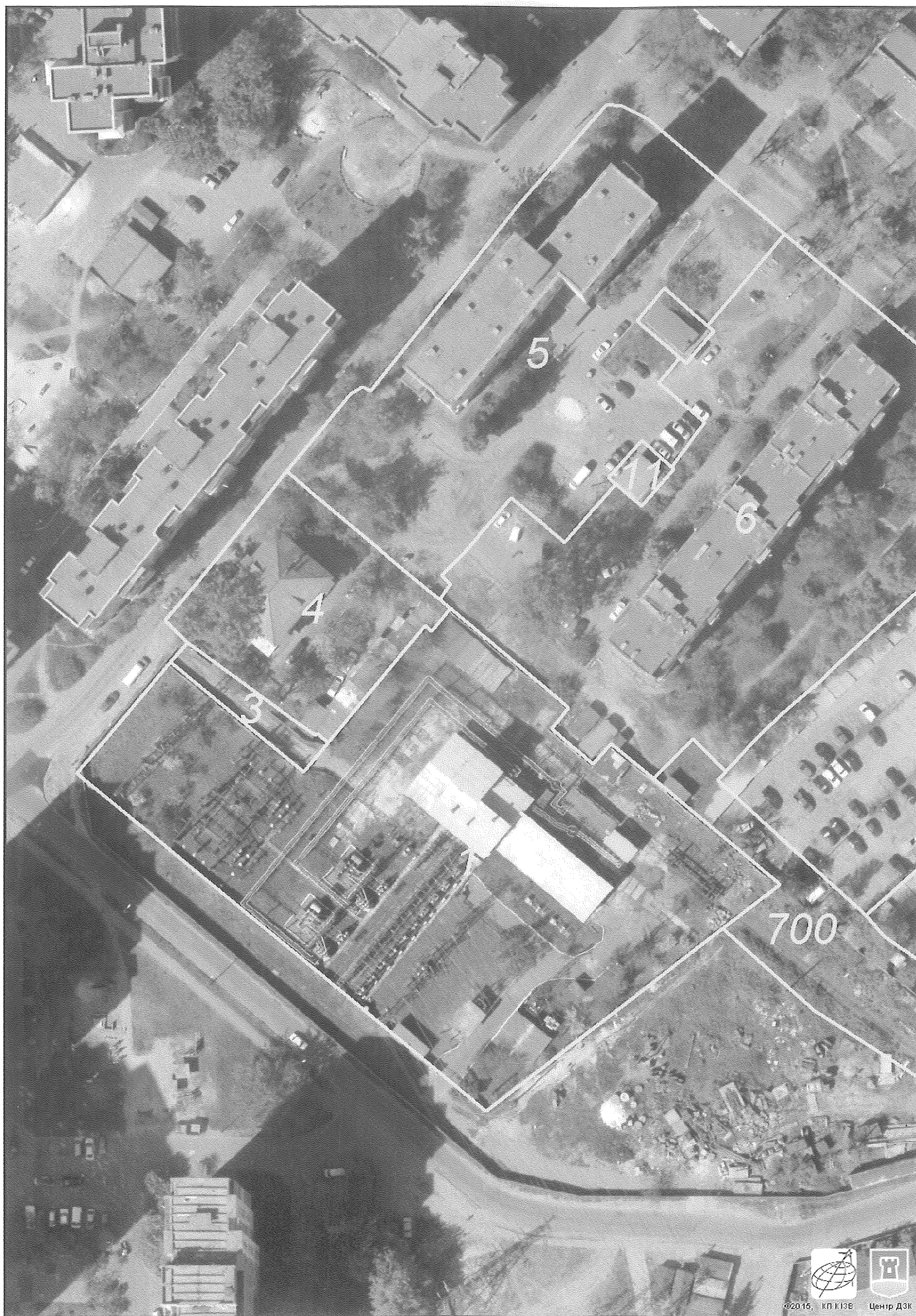
Растри аерофотозйомки 2014р.