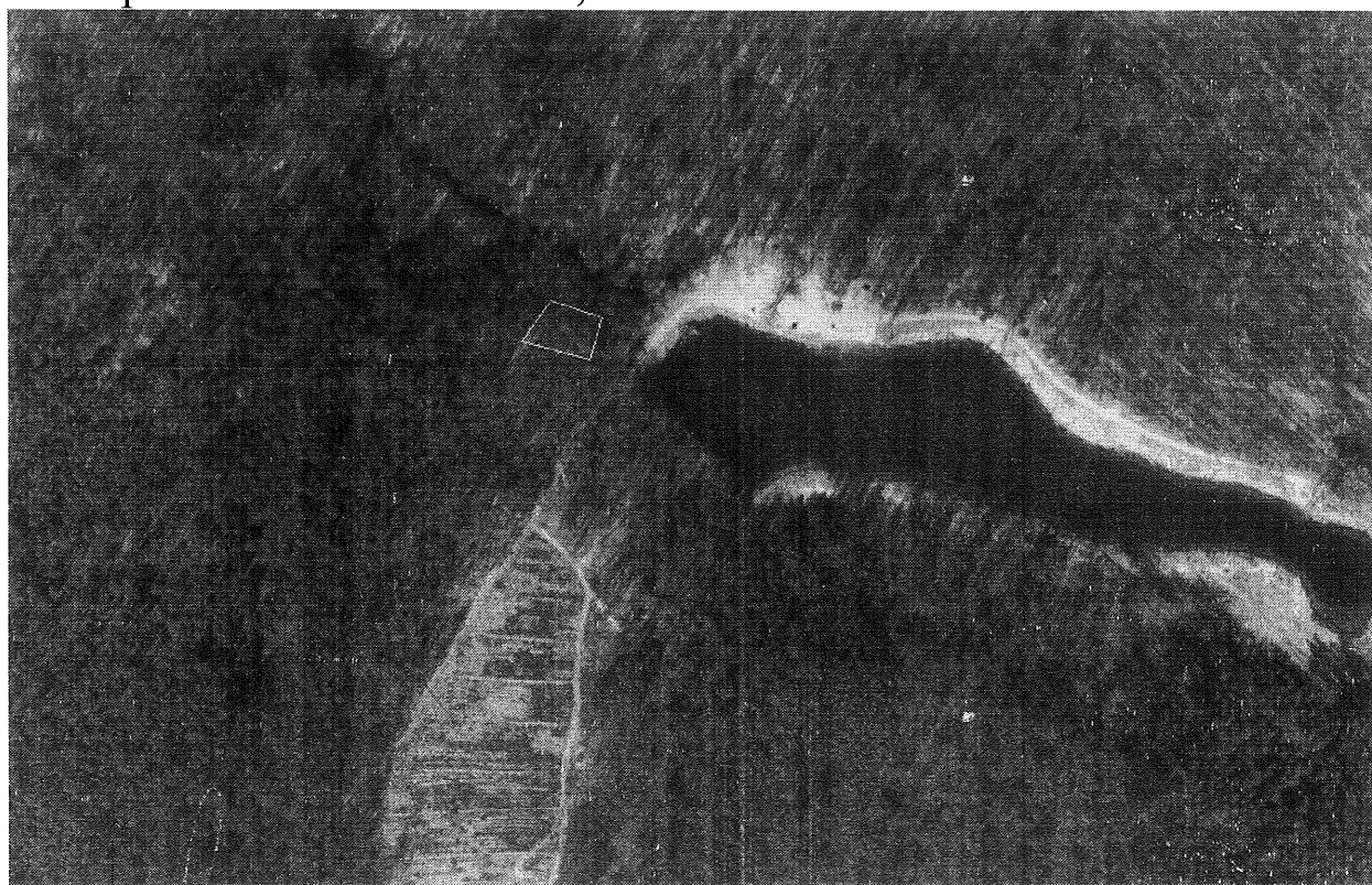
Ботанічна пам'ятка природи місцевого значення «Зозулин яр»

Вказаний фрагмент лісу презентує рослинні угруповання старого вільхового лісу що росте в яру та має місцеву назву «Зозулин яр». В яру є два джерела. Флора даного об'єкту налічує більше 15 видів вищих рослин.