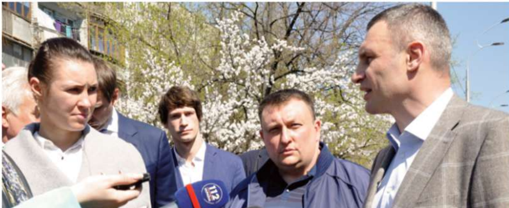
Спільна з мером Києва Віталієм Кличко перевірка ходу виконання капітального ремонту вулиці Алматинської