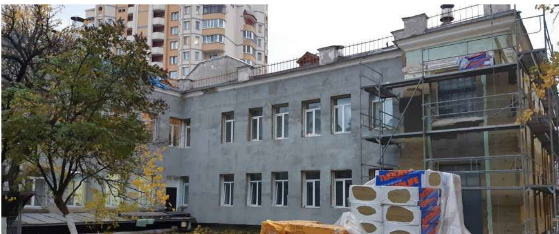
Утеплення фасаду ЗДО №700