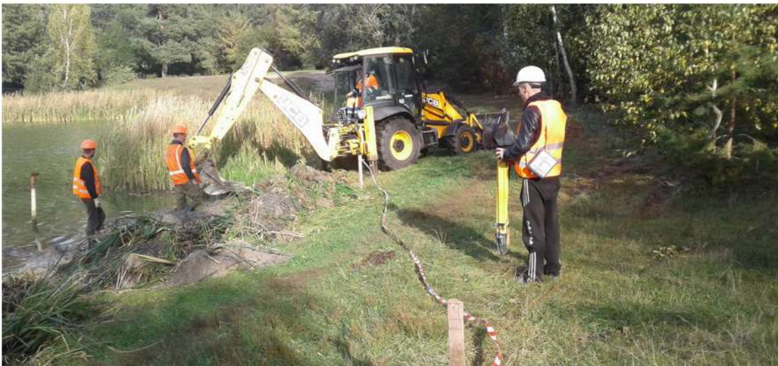
Благоустрій озера "Лісове"