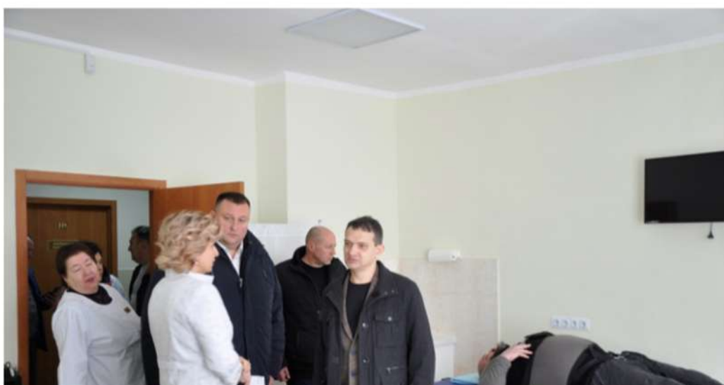
Зустріч з Уповноваженим Президента з питань реабілітації учасників АТО Вадимом Свириденко щодо вирішенні питання будівництва додаткового корпусу Центру реабілітації учасників АТО