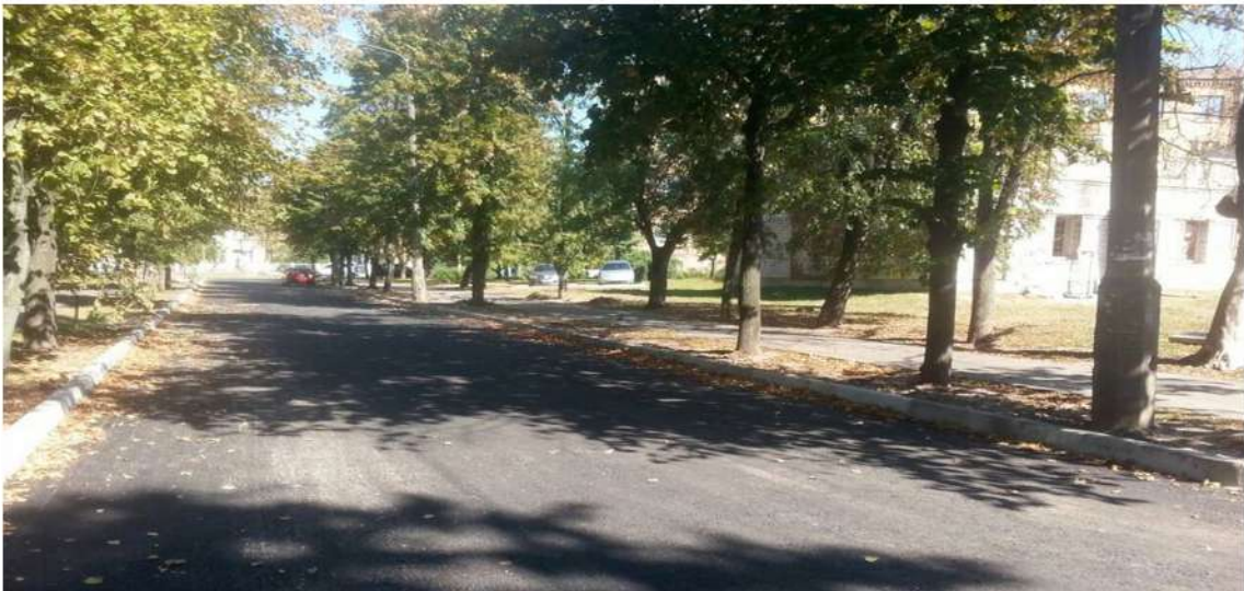
Асфальтування міжквартальних проїздів