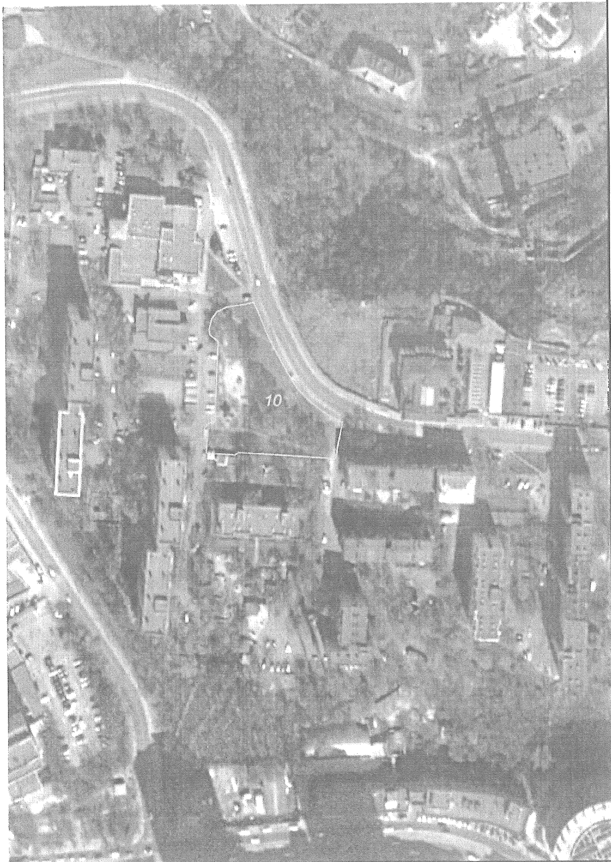
Матеріали супутникової фотозйомки 2016р.