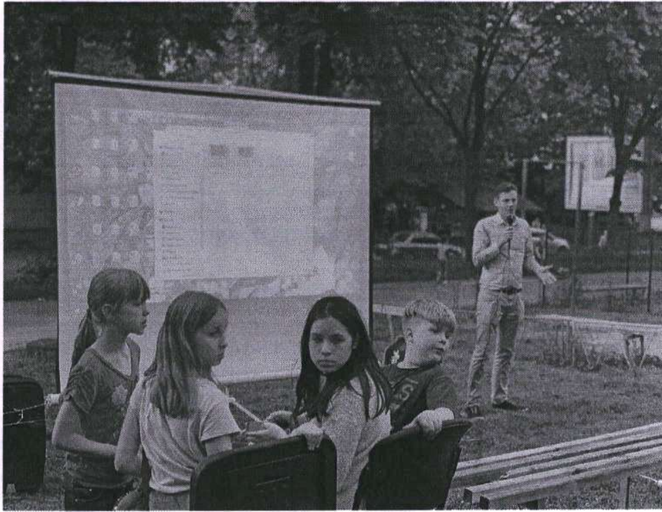
5. Лекція у школі до «Дня гідності та свободи» про початок Революції гідності та важливість молоді у процесах української політики.