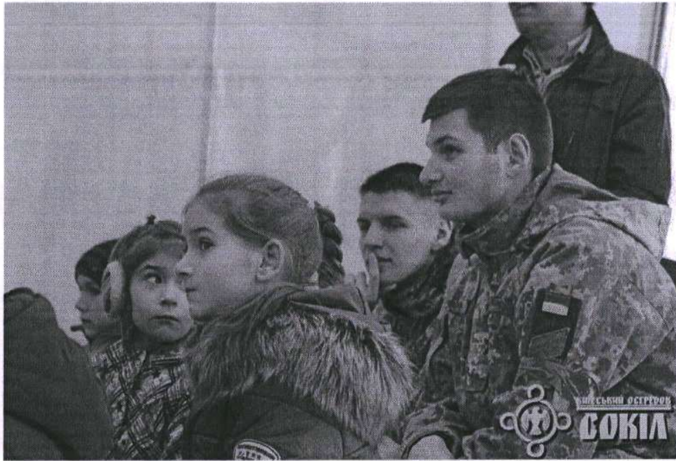
3. Проведення відкритого уроку для учнів старших класів в школі у місті Вишгород на тему «Українська політика в умовах російсько-Української війни»