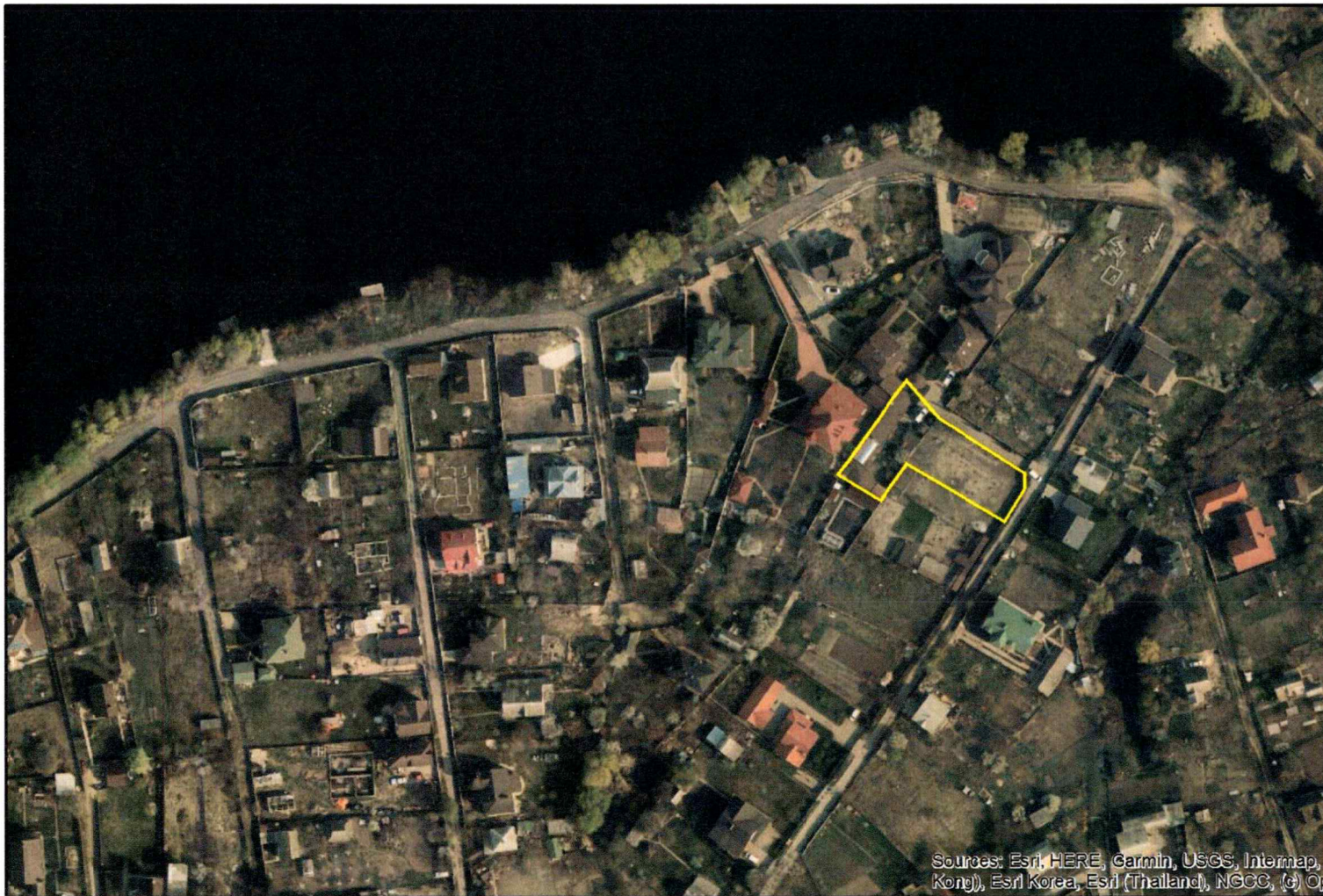
Матеріали аерофотозйомки 2019 р. виготовлено за даними АІС ОУЗР

Цільове призначення: 01.06, Для колективного садівництва