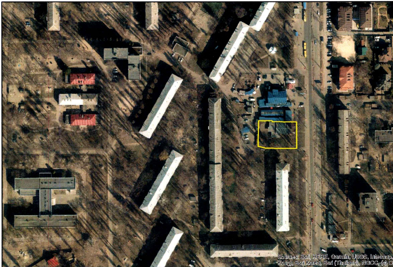
Матеріали аерофотозйомки 2019 р. виготовлено за даними АІС ОУЗР