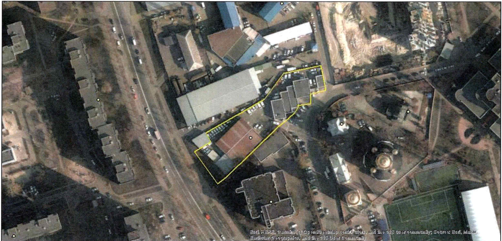
Матеріали аерофотозйомки 2019 р. виготовлено за даними АІС ОУЗР

Код земельної ділянки: 90:158:0117 Площа: 0.3608 га Адрес земельної ділянки: Дарницький район, вул. Архітектора Вербицького, 1-з Заявник: ПРИВАТНЕ АКЦІОНЕРНЕ ТОВАРИСТВО «ВФ УКРАЇНА» Вид та термін користування: оренда (10 р.) Цільове призначення: 13.01, для розміщення та експлуатації об'єктів і споруд телекомунікацій