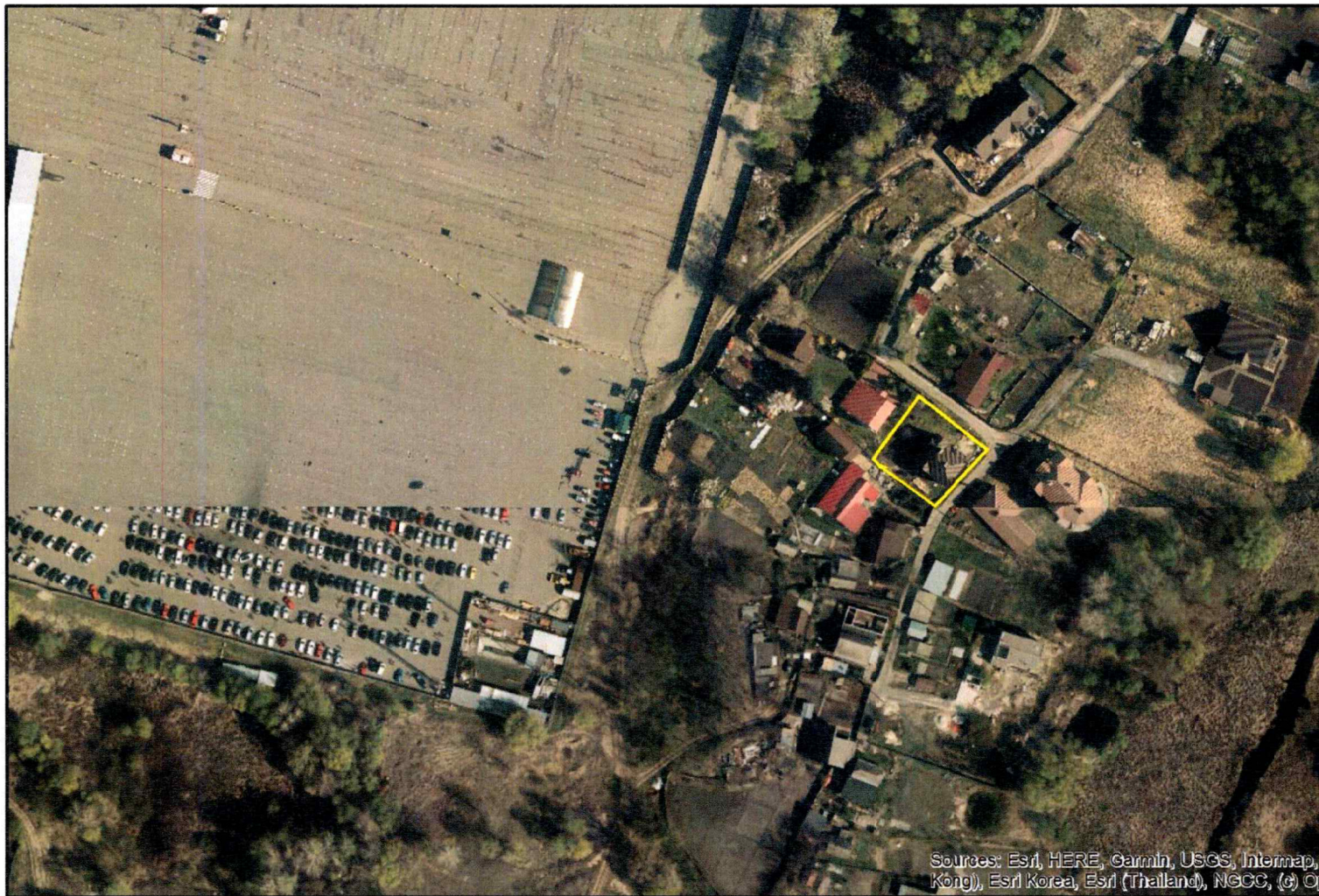
Матеріали аерофотозйомки 2019 р. виготовлено за даними АІС ОУЗР