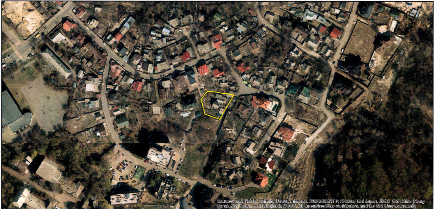
Матеріали аерофотозйомки 2019 р. виготовлено за даними АІС ОУЗР

Вид та термін користування: власність Цільове призначення: 02.01, для будівництва і обслуговування житлового будинку, господарських будівель і споруд (при садибна ділянка)