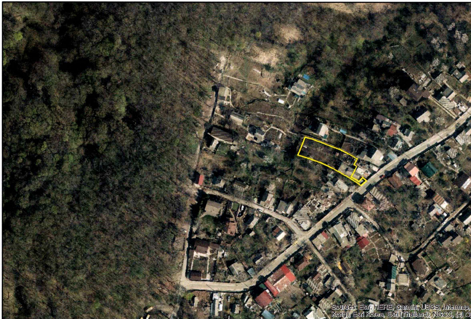
Матеріали аерофотозйомки 2019 р. виготовлено за даними АІС ОУЗР