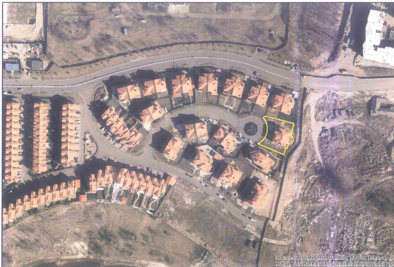
Матеріали аерофотозйомки 2019 р. виготовлено за даними АІС ОУЗР