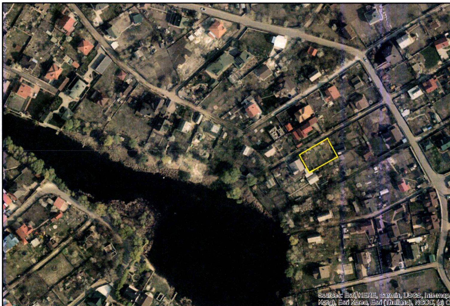
Матеріали аерофотозйомки 2019 р. виготовлено за даними АІС ОУЗР