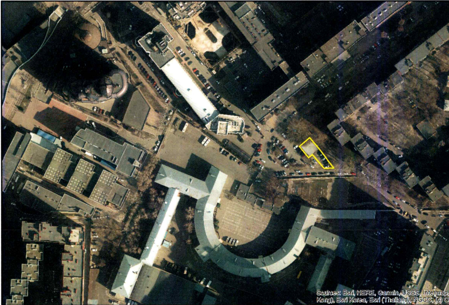
Матеріали аерофотозйомки 2019 р. виготовлено за даними АІС ОУЗР