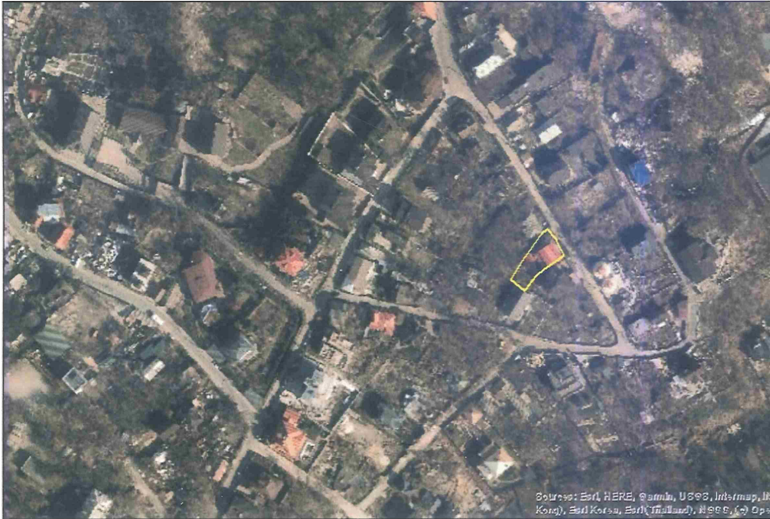
Матеріали аерофотозйомки 2019 р. виготовлено за даними АІС ОУЗР