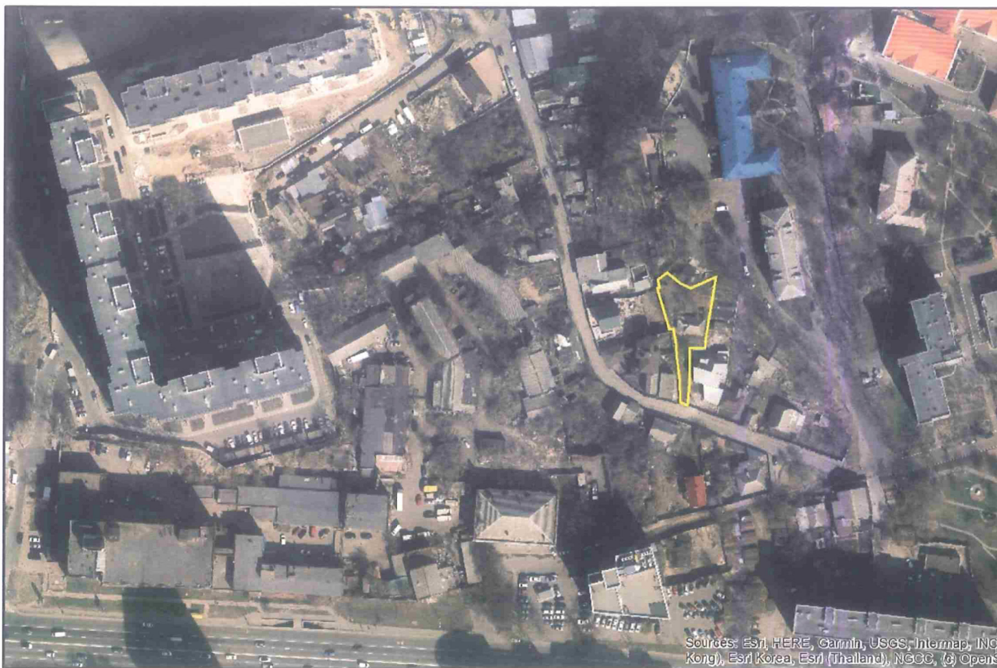
Матеріали аерофотозйомки 2019 р. виготовлено за ланими АІС ОУЗР