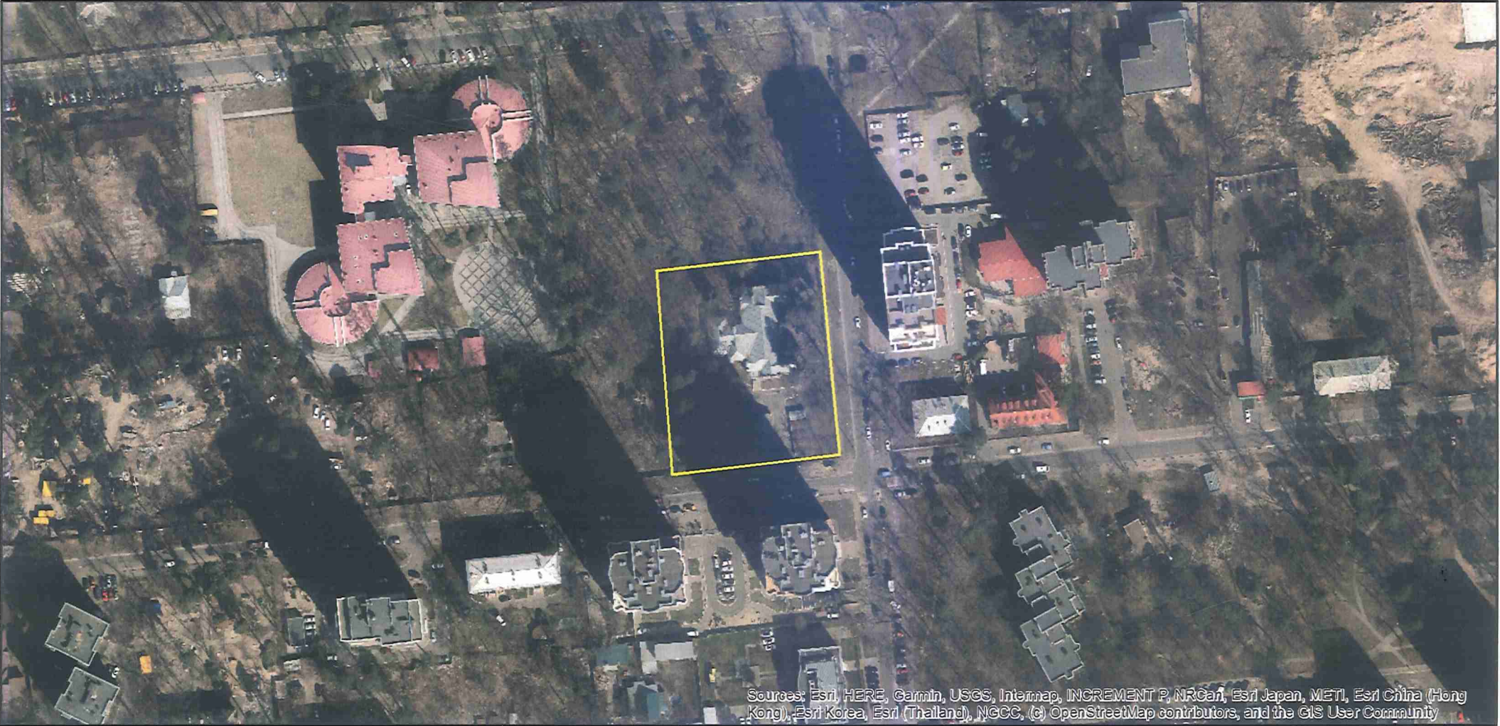
Матеріали аерофотозйомки 2019 р. виготовлено за даними АІС ОУЗР

Код земельної ділянки: 75:213:0103 Площа: 0.5600 га Адрес земельної ділянки: Святошинський район, вул. Івана Крамського, 10 Заявник: КОМУНАЛЬНЕ НЕКОМЕРЦІЙНЕ ПІДПРИЄМСТВО «КОНСУЛЬТАТИВНО-ДІАГНОСТИЧНИЙ ЦЕНТР» СВЯТОШИНСЬКОГО РАЙОНУ М. КИЄВА Вид та термін користування: постійне користування Цільове призначення: для будівництва та обслуговування будівель закладів охорони здоров'я та соціальної допомоги