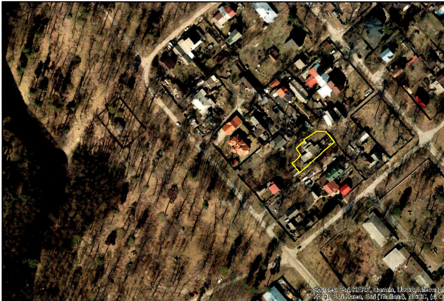
Матеріали аерофотозйомки 2019 р. виготовлено за даними АІС ОУЗР

Цільове призначення: для будівництва, обслуговування житлового будинку, господарських будівель і сп