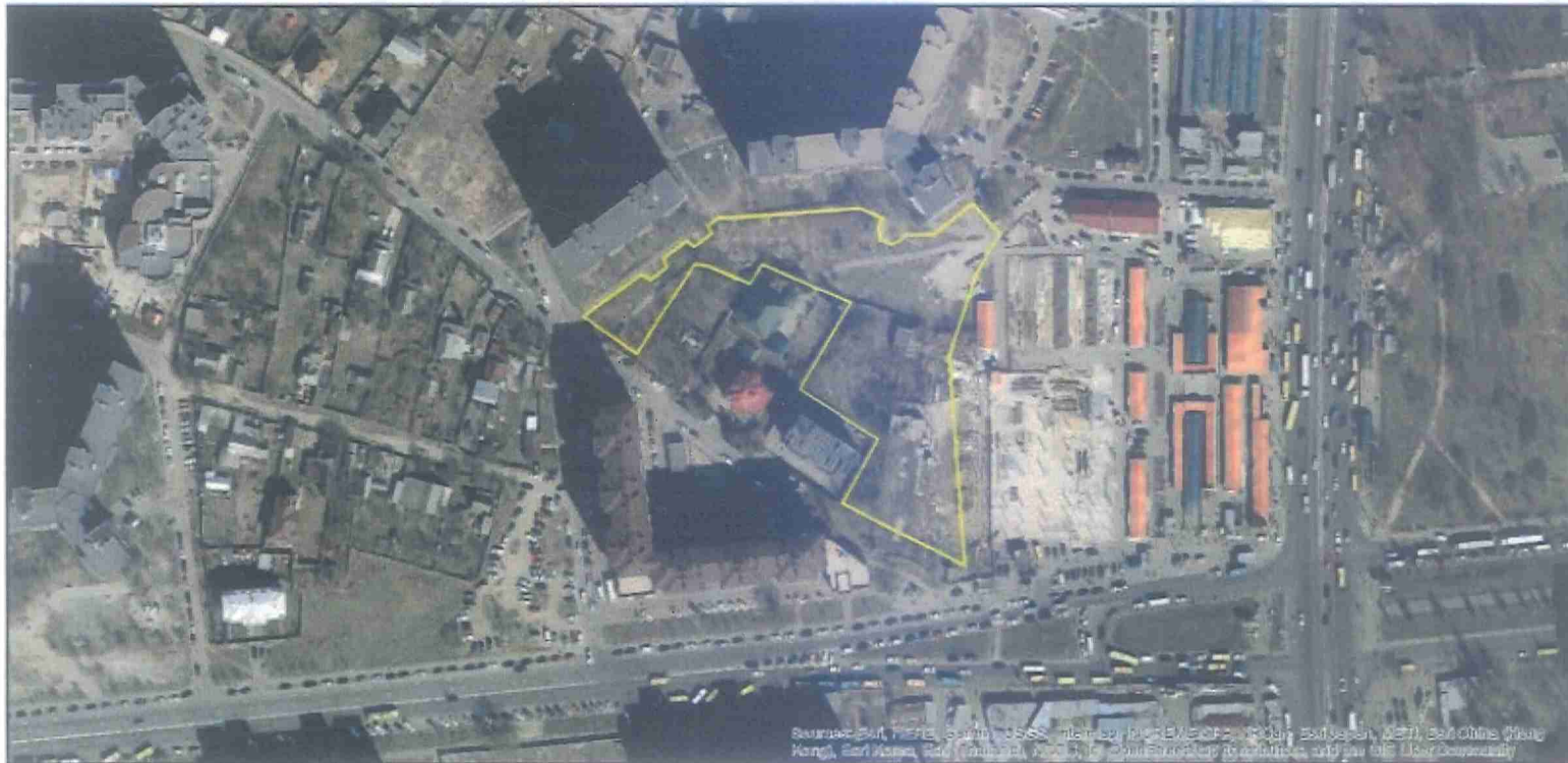
Матеріали аерофотозйомки 2019 р. виготовлено за даними АІС ОУЗР