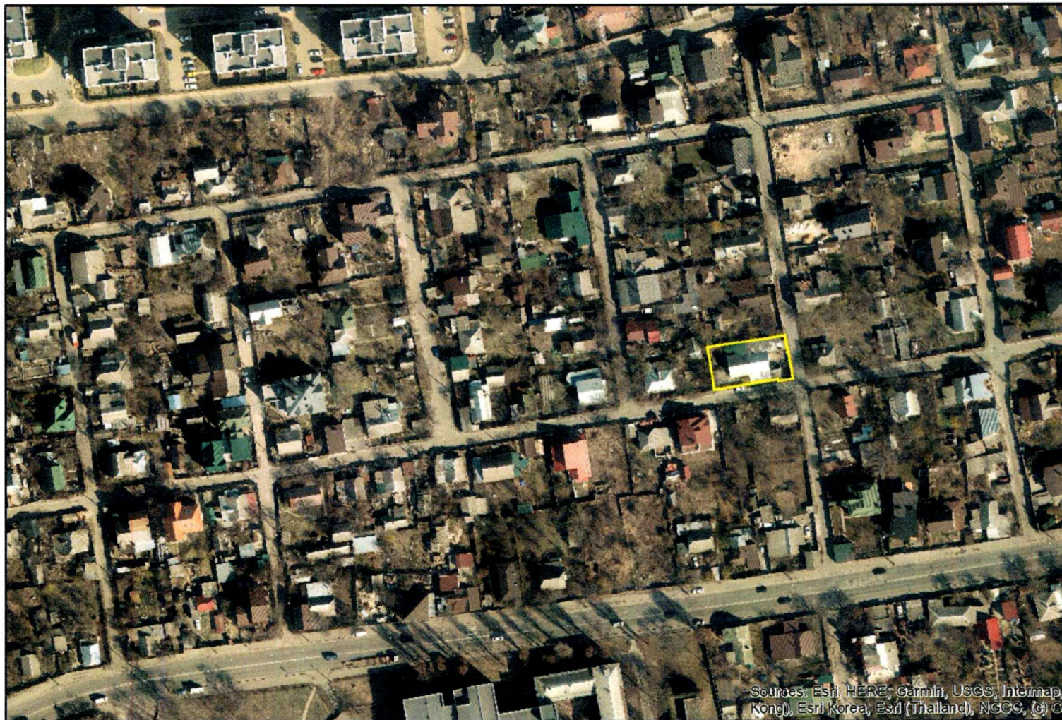
Матеріали аерофотозйомки 2019 р. виготовлено за даними АІС ОУЗР