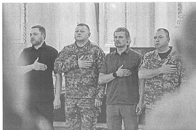
Участь Президента у церемонії вшанування Героїв України. 29 серпня 2022

Відзначився також і в розвитку волонтерства: соціальний молодіжний проєкт «У майбутнє через культуру» залучав охочих до прибирання та наведення ладу на історичних пам'ятках Хмельниччини , зокрема у Меджибізькій фортеці (з 2013 року) [15] [16] [17]